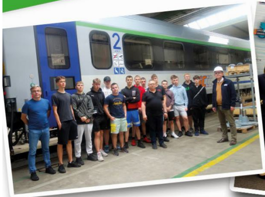
Fabryka Pojazdów Szynowych H. Cegielski w Poznaniu