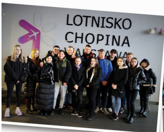
Port Lotniczy im. Fryderyka Chopina w Warszawie