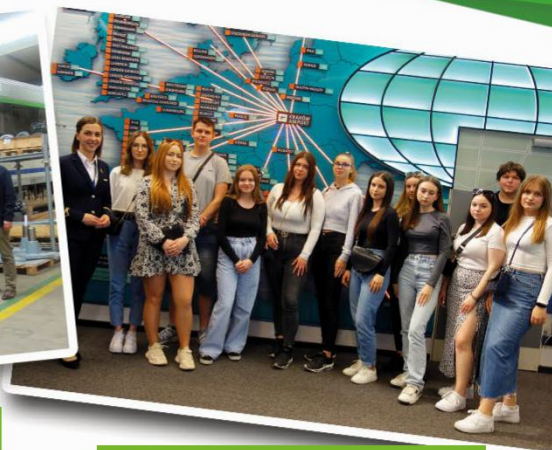
Centrum Edukacji Lotniczej w Krakowie