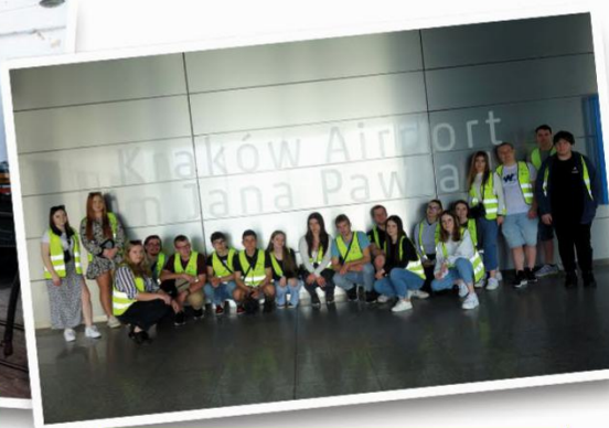
Międzynarodowy Port Lotniczy Kraków-Balice