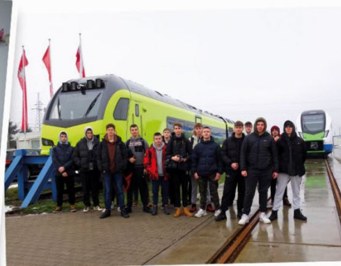
Zakład produkcyjny taboru kolejowego Stadler w Siedlcach