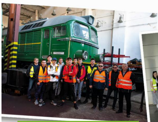
Lokomotywnia PKP Cargo w Białymstoku